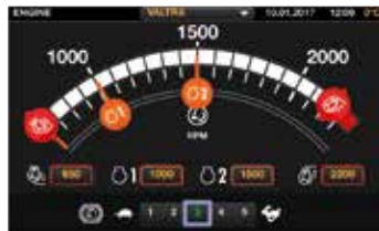
Logisk uppsättning av inställningar med svepgester. Alla inställningar lagras automatiskt i minnet.