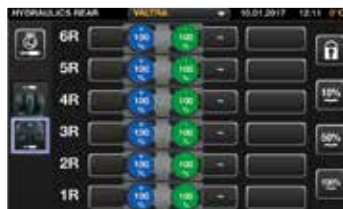
Enkelt att konfigurera arbetslamporna från terminalen. Strömbrytare för arbetslampor i armstödet med strömbrytare för varningsljuset.