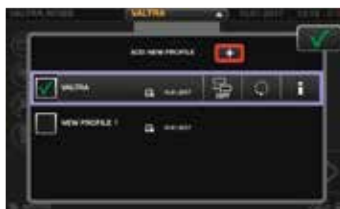
Profiler för användare och redskap som enkelt kan ändras från valfri skärmmeny. Alla ändrade inställningar kommer att sparas i den valda profilen.