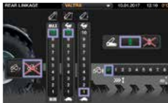
Intuitivt sätt att sätta upp inställningar med stora reglage och lättbegripliga funktioner.